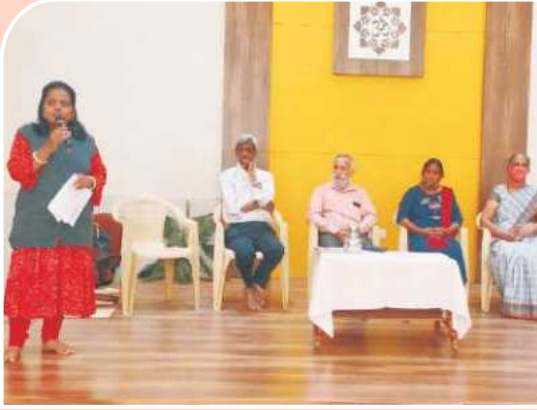
प्रशस्तीपत्रक वितरण - रुग्णसहाय्यक वर्ग