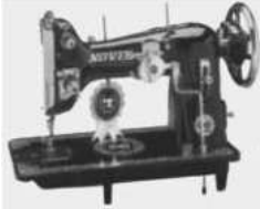
Designer Model (with chain & gear)

मुख्य कार्यालय : १४४४, शुक्रवार पेठ, थोरले बाजीराव मार्ग, पुणे ४११००२. फोन : ०२०-२४४५३२५८ / ५९ टोल फ्री क्रमांक : 1800 233 3258 (बँकेच्या सुट्टीचे दिवस सोडून) www.janatabankpune.com