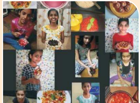
शाखा विभाग - ऑनलाईन पाककला स्पर्धा