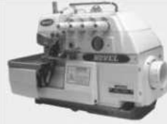
NL-737/747/757 Novel 3/4/5 Thread High Speed Machine Overlock