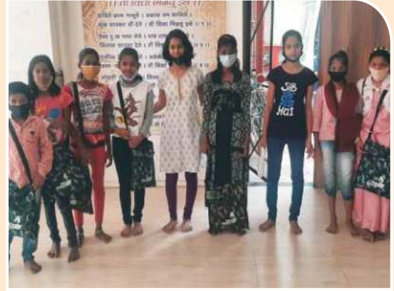
शैक्षणिक साहित्य वाटप