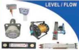
LEVEL / FLOW