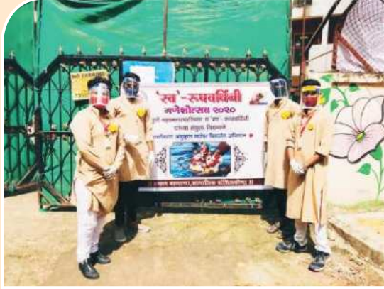
गणेशोत्सव मुर्ती संकलन