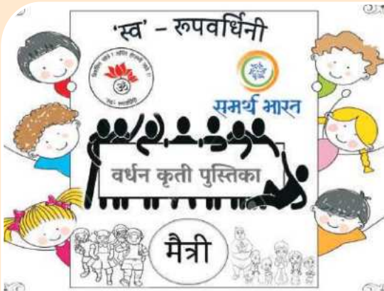
वर्धन कृती पुस्तिका उपक्रम