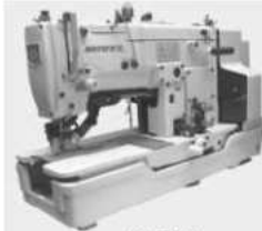
NL-781 Button Hole Machine