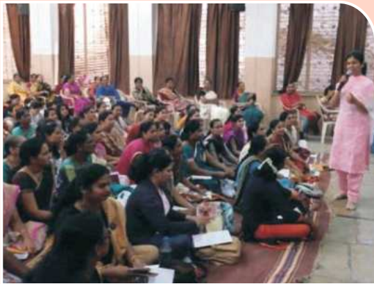
समुपदेशन - पालक कार्यशाळा