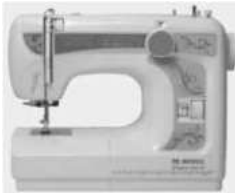
Designer Auto Zigzag Portable Models DA 33 / 39 / 55