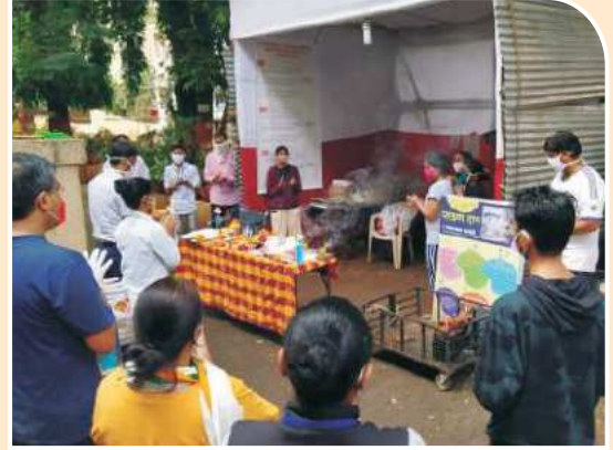
प्लाज्मा दान शिबीर