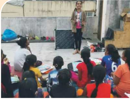
उत्कर्षा अभ्यासिका काशेवाडी वस्ती