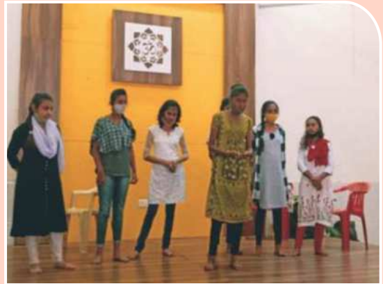
समुपदेशन - कळी उमलताना - प्रसंग नाट्य