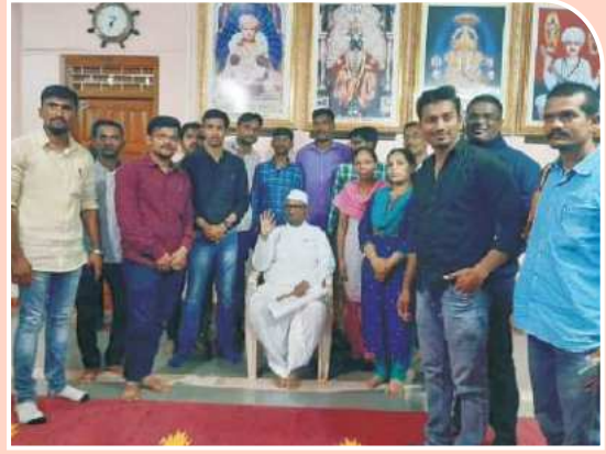
राळेगणसिद्धी ग्राम भेट