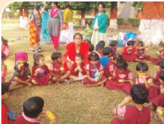
संभाजी उद्यान सहल