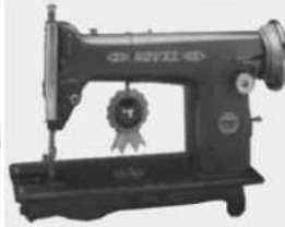
95 T - 10 Model