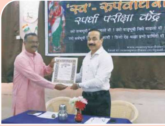
शिष्यवृत्ती वर्ग उद्घाटन