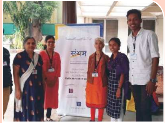
समुपदेशन -संयम कार्यशाळा सहभाग