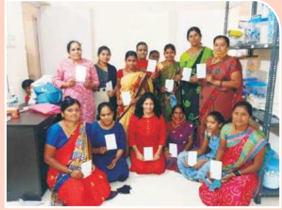
व्यवसाय बचत गट