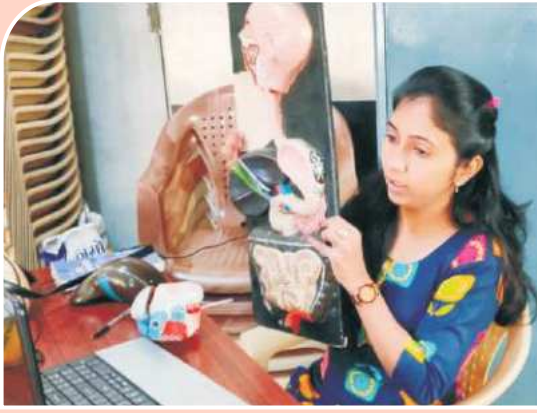
ऑनलाईन रुग्णसहाय्यक वर्ग