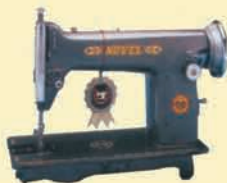
95 T - 10 Model