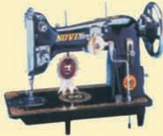
Designer Model (with chain & gear)