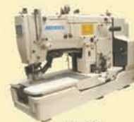
NL-781 Button Hole Machine