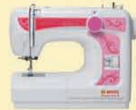
Designer Auto Zigzag Portable Models DA 33 / 39 / 55