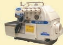
NL-737/747/757 Novel 3/4/5 Thread High Speed Machine Overlock