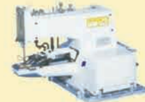
NL 1377 Chainstitch Buttonstitch with 2 type operation Machine