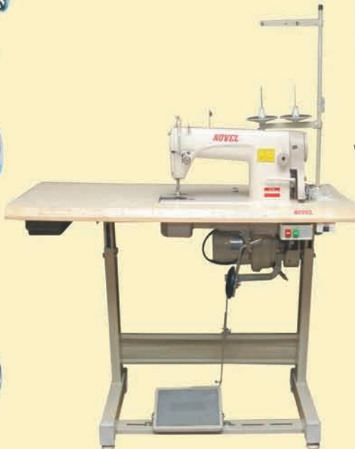
NL - 550 Single Needle Lockstich High Speed Auto Lubrication Machine Complete Set.