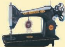
TA-1 Umbrella Model